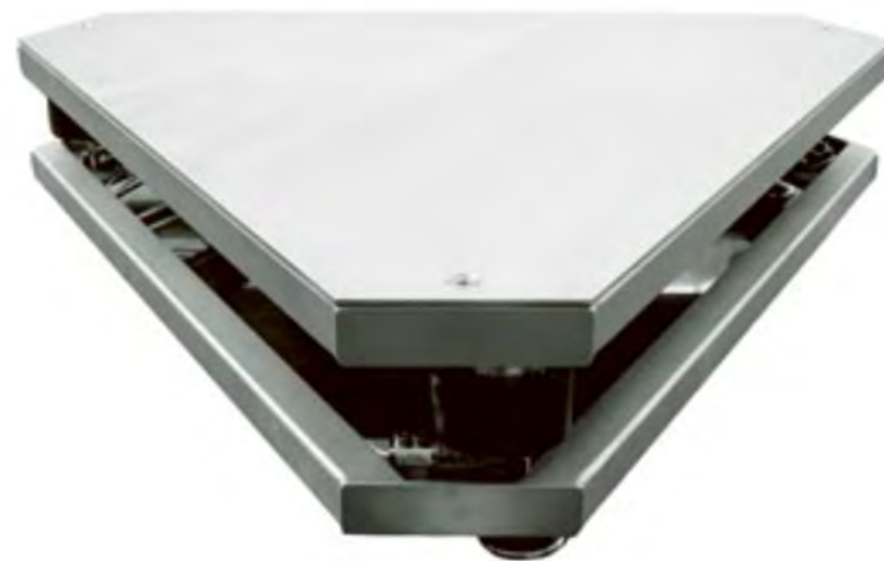
Компаратор массы 2 000 кг